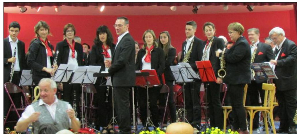
■ Les deux harmonies, environ 70 musiciens, ont été très applaudies pour leur prestation respective et le final à l'unisson.

Récemment, le concert d'automne de l'Avenir musical s'est déroulé en salle des fêtes en collaboration avec l'orchestre d'harmonie municipale de Baume-les-Dames.