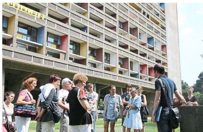
5 000 personnes visitent la maison radieuse, chaque année.