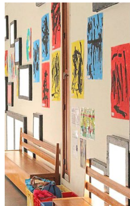
L'intérieur de l'école maternelle, sur le toit de la cité.

Pour autant, depuis 60 ans, tous les incendies ont été limités à un seul logement. Et il n'y a jamais eu d'évacuation du bâtiment. Entre 1985 et 2000, des travaux ont été menés : recouplement des gaines, désenfumage des escaliers, rénovation des bornes incendie et création d'une voie pompiers. Ceux-ci viennent en manœuvre deux fois par an. Et, en octobre dernier, la commission de sécurité a rendu un avis favorable.