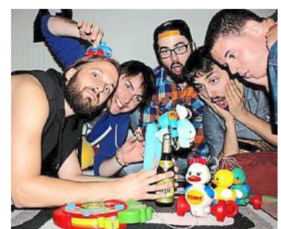
Le groupe rennais Hipskôr sera sur la scène du Canon à Pat', ce samedi.

Uncensored a été créé en 2011. Le groupe jouait du punk-metal avec des racines hardcore. Il a enregistré en 2011, son premier album, First blood . Il a opté, par la suite, pour un style orienté plus métal. Ils revien-