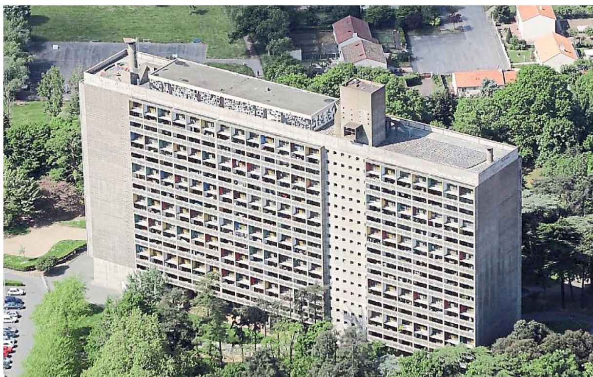
108 m de long, 19 de large et 52 de haut : telles sont les dimensions de la maison radieuse.

Ce monument historique, 5 000 personnes le visitent chaque année.