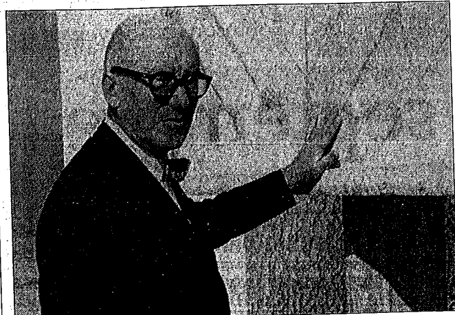
■ Le Corbusier lors de sa dernière visite à Ronchamp.