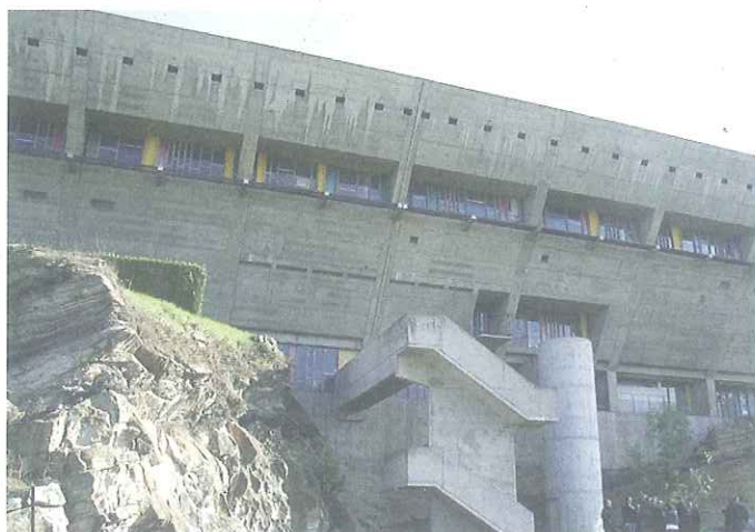
La Maison de la Culture de Firminy

110 mètres de long, 14 mètres de large sur trois niveaux : le bâtiment, adossé à la falaise surplombant le stade situé dans une ancienne carrière, comprend une salle de spectacle avec ses annexes, un foyer-bar, des galeries d'exposition, un auditorium, des bureaux. La couverture repose sur un système de câbles lui donnant l'aspect d'une voûte inversée. Classée au titre des Monuments historiques depuis 1984, la Maison de la culture est toujours en activité ; elle a fait l'objet d'une campagne de restauration entre 2009 et 2014.