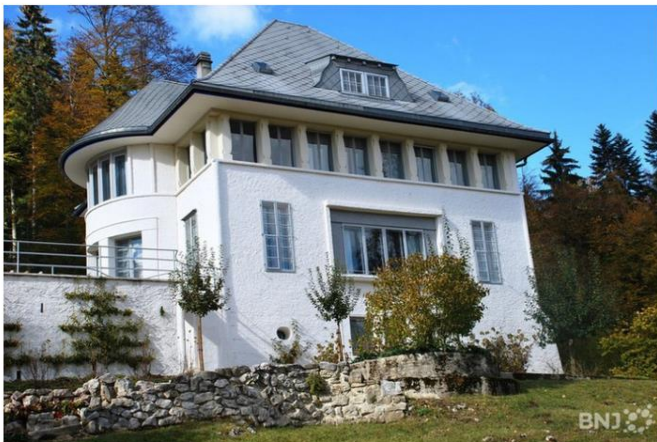
La Maison blanche à La Chaux-de-Fonds. (Photo d'archives).

Le Conseil de l'Europe a désigné un itinéraire lié au Corbusier « itinéraire culturel européen ». La Maison blanche à La Chaux-de-Fonds en fait partie