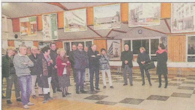
■ Dans la salle d'animation qui porte son nom.

En 2015, cinquante ans après sa disparition, le conseil municipal avait décidé de renommer la salle d'animation au nom de l'architecte. Une exposition hommage présente ses grandes œuvres.